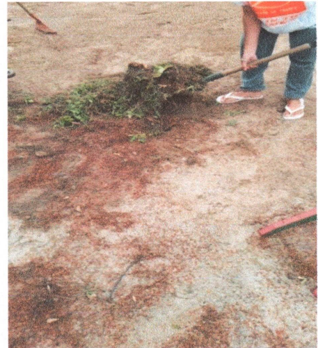
Visita de monitoramento da SEDIS / Equipe Técnica da Gestão do SUAS – dia 16/08/2023